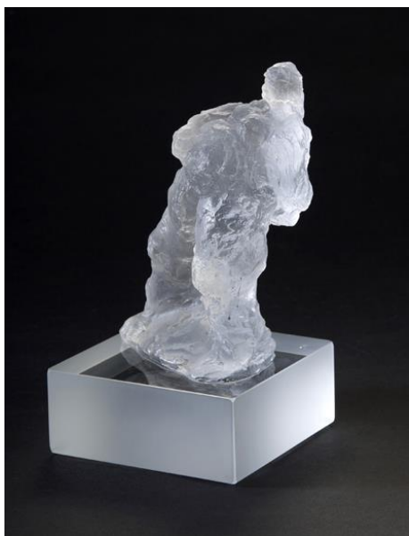
Stående kvinde – glas