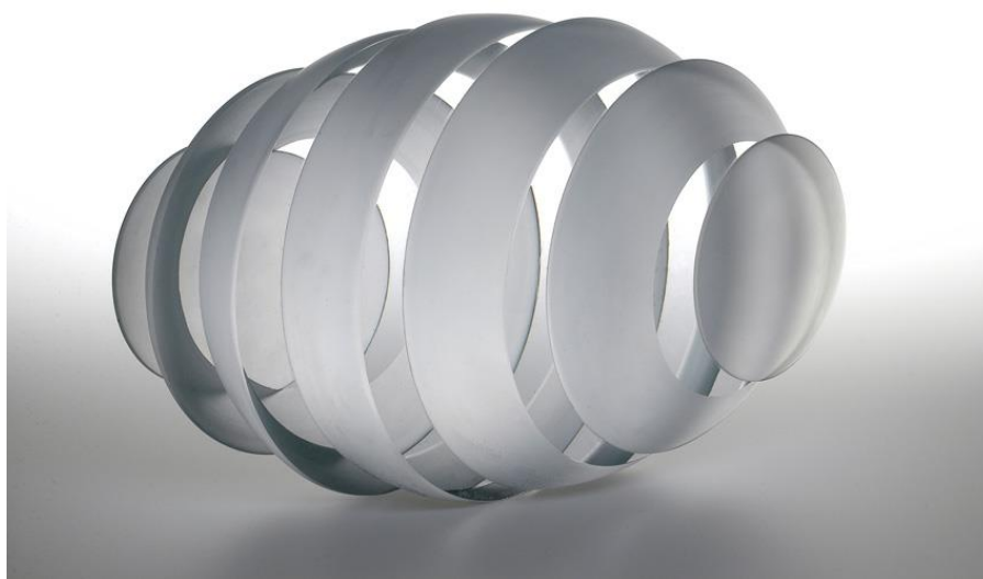
Sfære – sandblæst, slebet